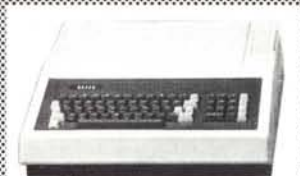
Elite Dual Processor 6502, Z80